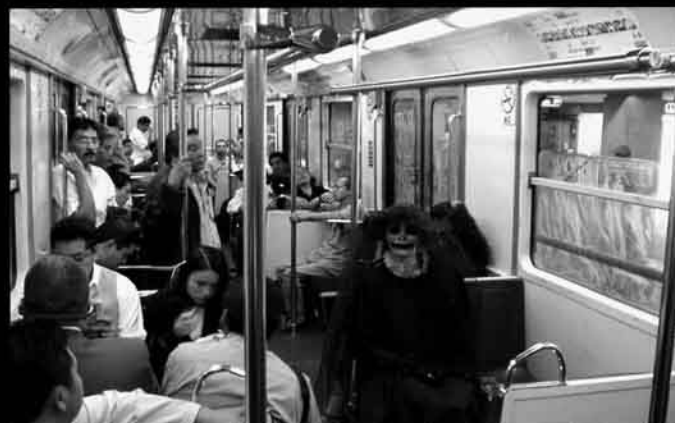
Para la mayoría de los nuevos directores austriacos el mundo moderno "atestigua la reinención de los géneros cinematográficos".