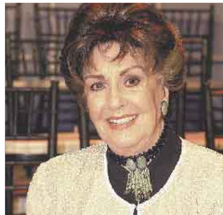
MARGA LÓPEZ: La actriz presenta un estado crítico.

"Es mentira que haya sufrido de un infarto. Ahora está en terapia intensiva para una observación porque tuvo algunas complicaciones