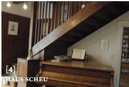
[4] HAUS SCHEU