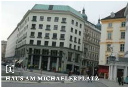
[1] HAUS AM MICHAELERPLATZ