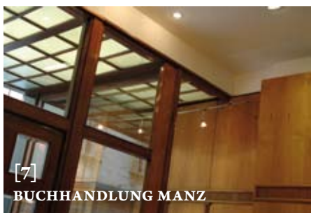
[7] BUCHHANDLUNG MANZ