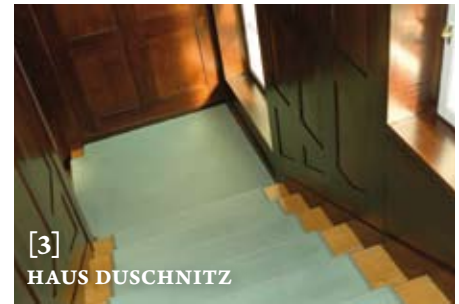
[3] HAUS DUSCHNITZ