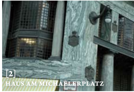
[2] HAUS AM MICHAELERPLATZ