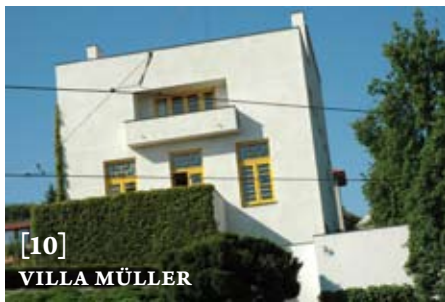
[10] VILLA MÜLLER