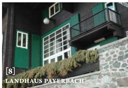
[8] LANDHAUS PAYERBACH