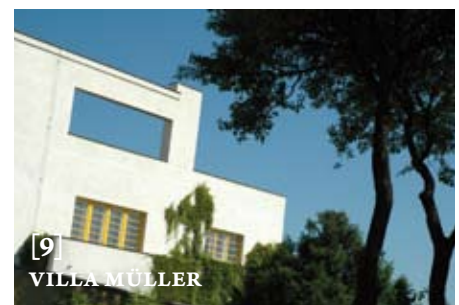
[9] VILLA MÜLLER