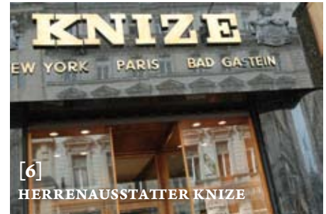
[6] HERRENAUSSTATTER KNIZE